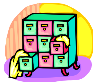
Muele muele Mueble

Dibuja las siguientes oraciones y luego repítelas en voz alta